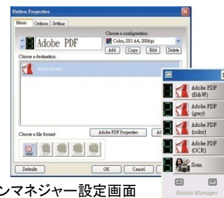
ボタンマネージャー設定画面